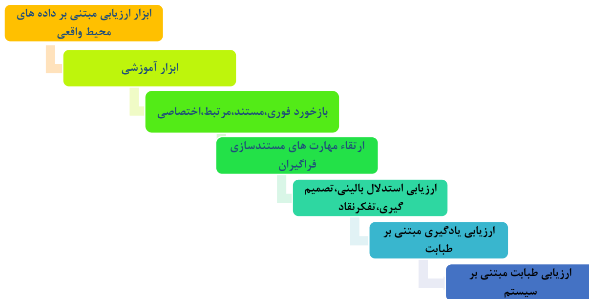
شکل ۲ مزایای آزمون CSR