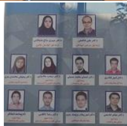
[4] View the full image